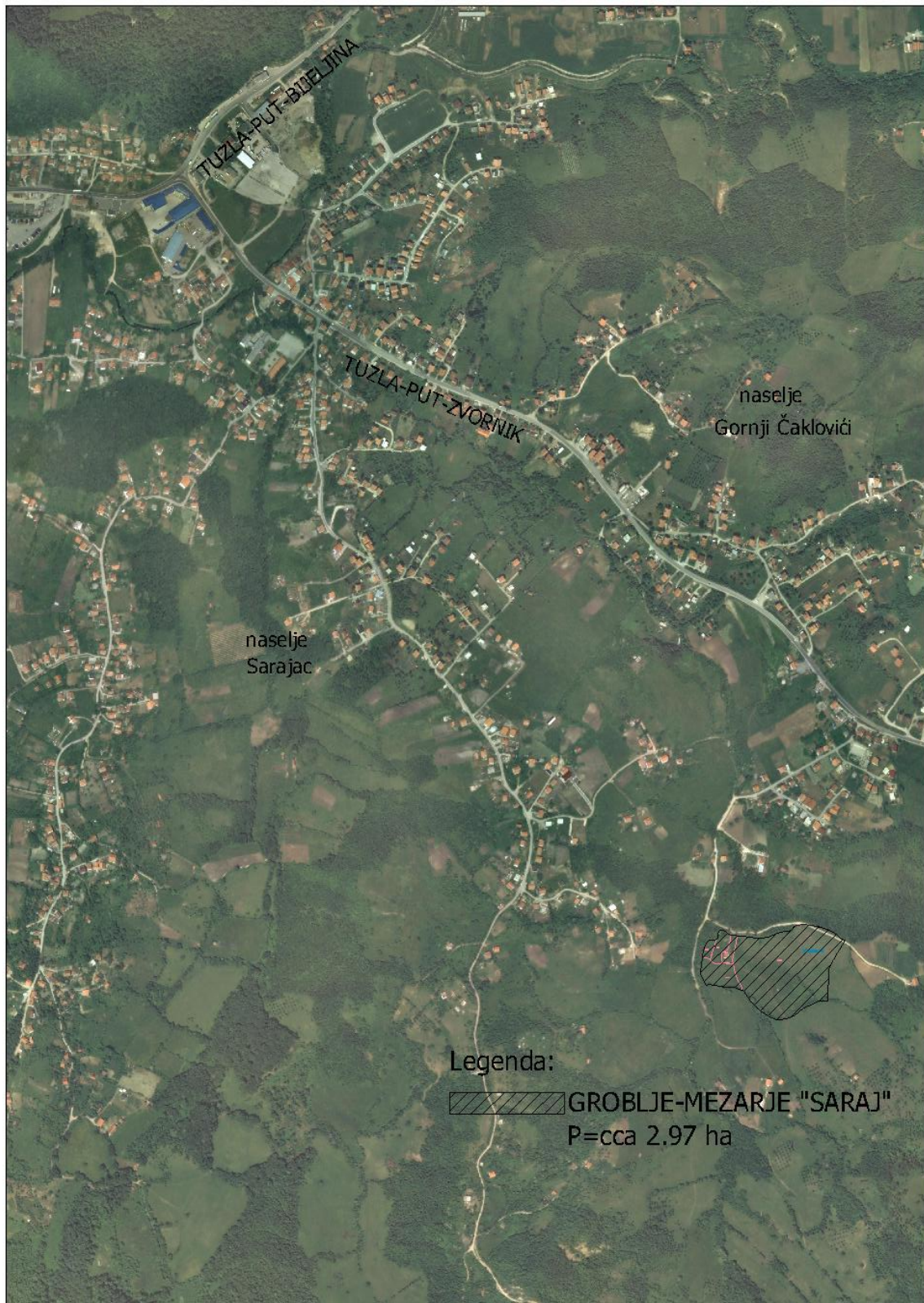
LOKALITET GROBLJA-MEZARJA "SARAJ"